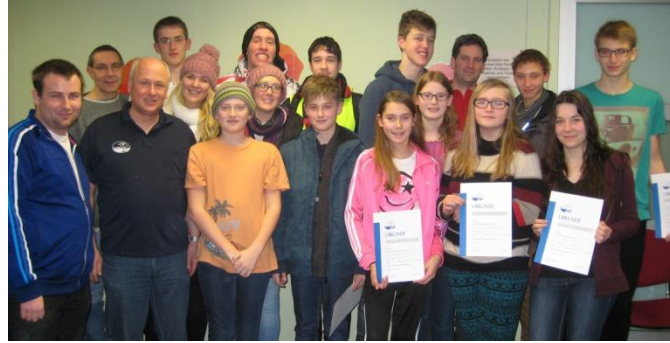
Teilnehmer DLRG-Ortsgruppenmeisterschaft 2015