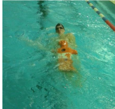
Abschleppen einer Rettungspuppe