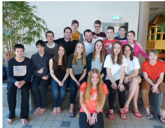
Das Team der OG Hürth bei der Bezirksmeisterschaft 2015